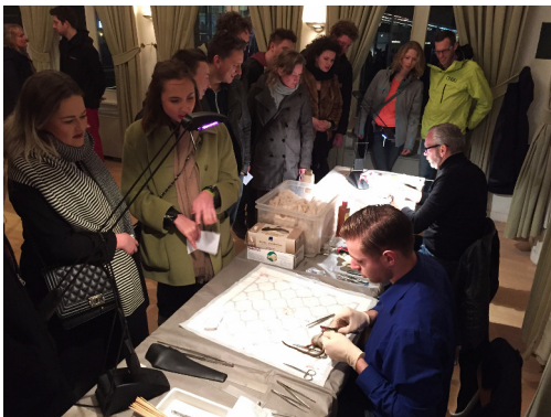
Preparateurs aan het werk

https://www.youtube.com/watch?v=UgVm23TRz0A